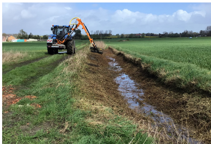
Opération de fauchage au Plantis