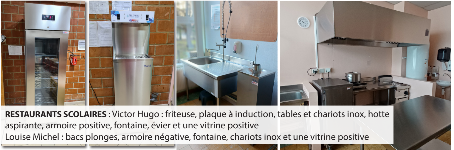
RESTAURANTS SCOLAIRES : Victor Hugo : friteuse, plaque à induction, tables et chariots inox, hotte aspirante, armoire positive, fontaine, évier et une vitrine positive Louise Michel : bacs plonges, armoire négative, fontaine, chariots inox et une vitrine positive

Le plan France Relance de 100 milliards d'euros. Ce volet s'articule autour de 3 priorités : reconquérir notre souveraineté alimentaire, accélérer la transition agroécologique et accompagner l'agriculture et la forêt françaises dans l'adaptation au changement climatique. Une demande de subvention a donc été faite au hauteur de 23356€ dans le but de lutter contre le gaspillage alimentaire et substituer les contenants en plastique. Le ministère de l'agriculture et de l'alimentation a attribué la somme de 21320€.